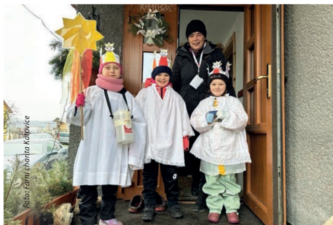
Tři králové koledovali v Katovicích.