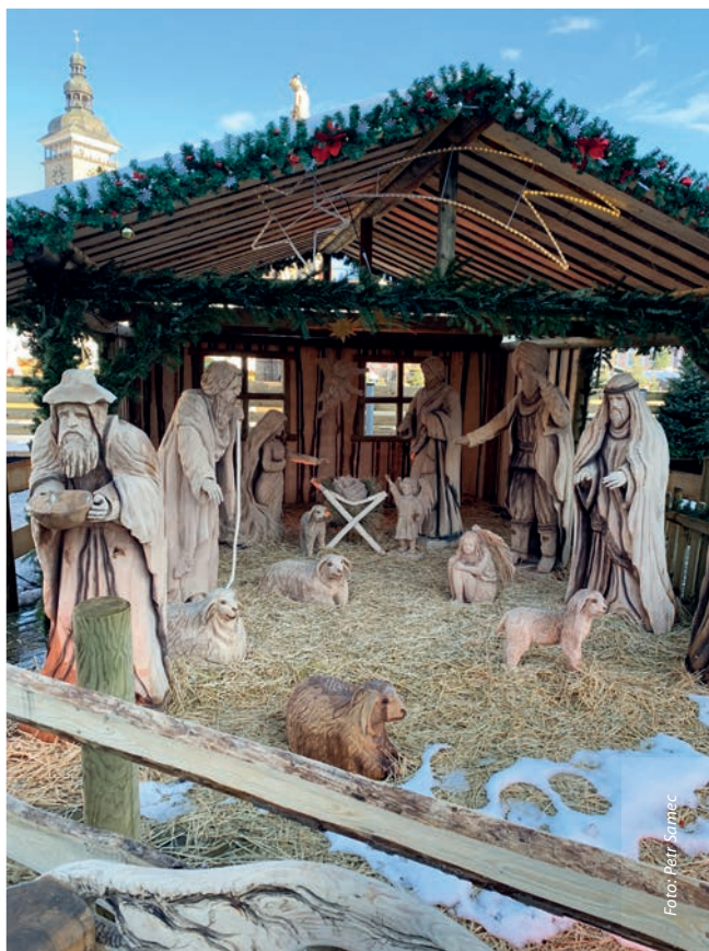
Velký vyřezávaný betlém bývá každý rok během adventu vystavený na českokobudějovickém náměstí.

I když tato událost ze života sv. Františka na první pohled uzavřela hledání pravdy o původu stavění betlémů, situace není z dějinného pohledu až tak jednoznačná. Již ve 3. století některé malby na kameni, slonovině nebo skle znázorňovaly