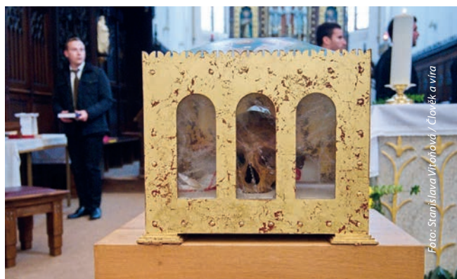
Relikviář s lebkou sv. Tomáše Akvinského byl vystaven v chrámu Obětování Panny Marie v Č. Budějovicích.

Ostatky nám připomínají, že Bůh obnovil vtělením, křížem, zmrtvýchvstáním a nanebevstoupením Ježíše Krista celé stvoření. Člověku, který je jednotou duše a těla, přislíbil život. Svatí, kteří skončili své pozemské putování, nejsou mrtví. Vidí Boha a jsou živí par excellence, i když ještě očekávají vzkříšení těla na