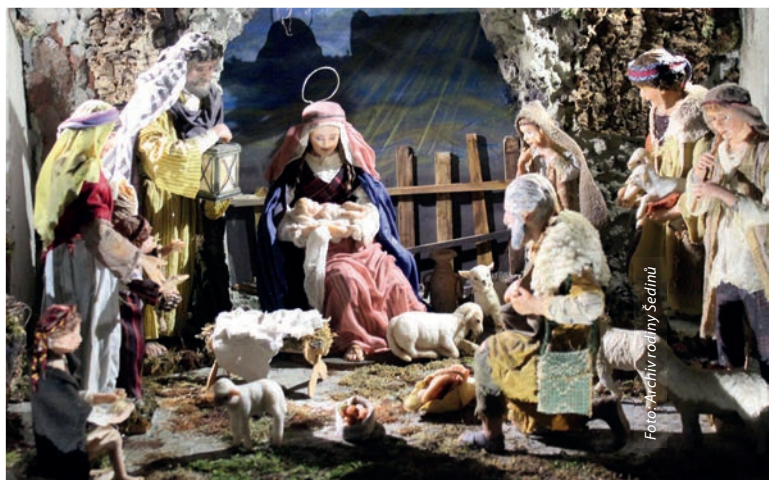
Betlém ze sbírky rodiny Šedinů.