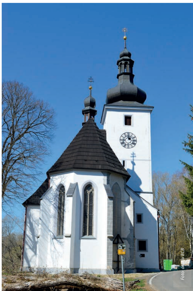
Součástí Gotické stezky bude i dosud uzavřený kostel Narození Panny Marie v Cetvínách.

Součástí projektu bude také široké využití moderních digitálních metod: kostely si bude možné prohlédnout na internetu formou virtuálních prohlídek nebo 3D modelů a vznikne mobilní aplikace s mapovým portálem, odkazy na lokální gast-