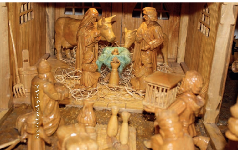
Detail nejdůležitější scény Blatského betlému.

Betlémy u Šedinů – tak zní název každoročně otevírané výstavy vánočních betlémů v Bechyni, U Stadionu 356. Naše rodina řezbářů vždy v době adventní dává návštěvníkům možnost obdivovat řadu krásných vánočních betlémů.