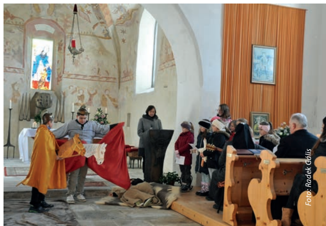
Kájovské děti zahrály příběh patrona kostela v Polné.