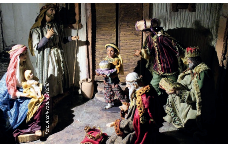
Betlém ze sbírky rodiny Šedinů.