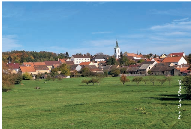
Pohled na město Bělčice.