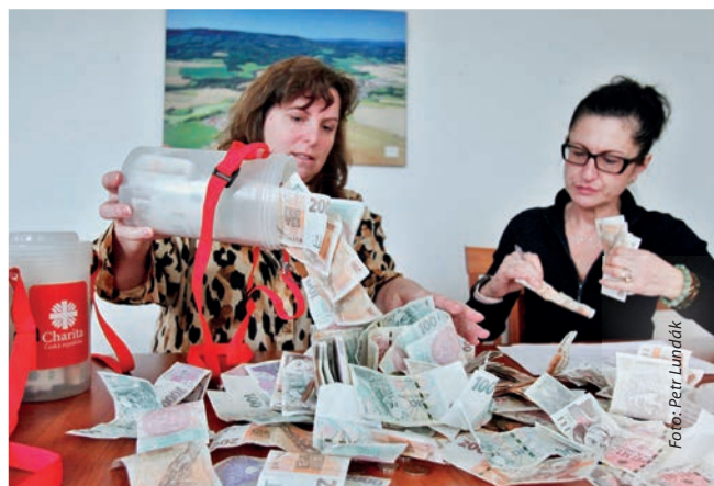
Sečítání peněz z tříkrálové pokladničky.